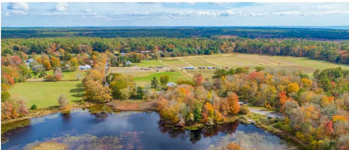
Estanque Tinkham Pond y las tierras al ser protegida en Long Plain Road en Mattapoissett.

Los 240 acres de tierra han sido asegurados por un contrato de compra y venta con su propietario actual, Mahoney and Sons, por $5,980,000. Este precio está respaldado por una tasación reciente e independiente del valor del terreno. Se anticipan $80,000 adicionales en los costos del proyecto, que incluyen tasaciones, estudios, evaluaciones ambientales, revisión de títulos, legal, desarrollo de restricciones de conservación y costos de registro.